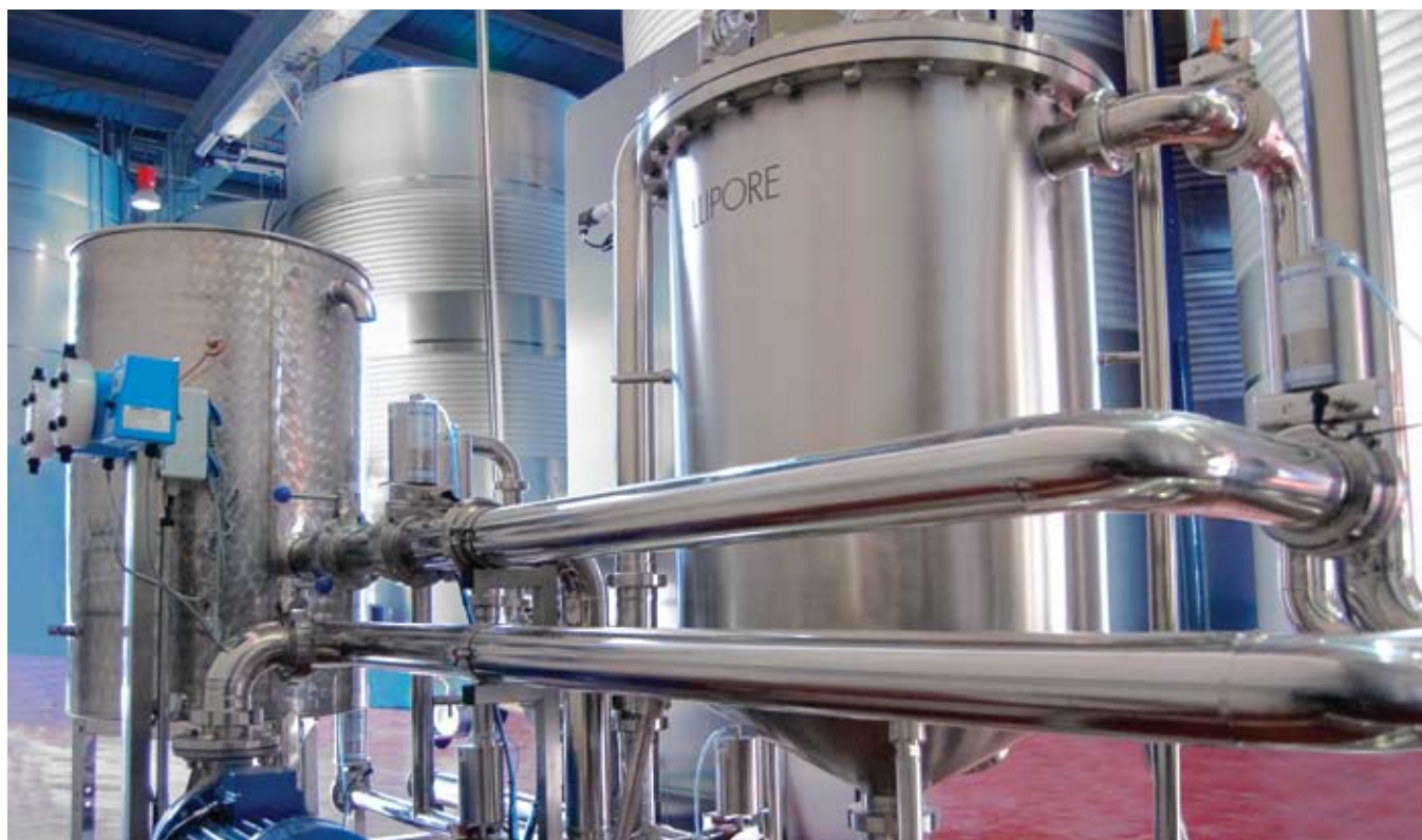
Figura 3: Un sistema Millichilling

El método recibió la patente EP08382063 el 11 de noviembre de 2008.